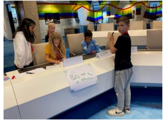
Groep 7 in het Raadhuis

Kinderboekenschrijfster Charotte Dematons kwam langs op school om enthousiast te vertellen over haar boeken en om te laten zien hoe zij haar tekeningen maakt. Daarna heeft ze alle tijd genomen om eigen boeken van leerlingen en boeken uit onze bibliotheek te signeren inclusief een mooie tekening.