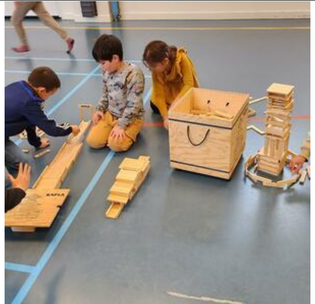
Groep 5 aan de slag met Kapla