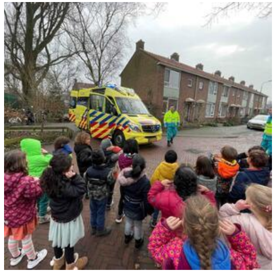
De ambulance kwam langs op het kleutergebouw.