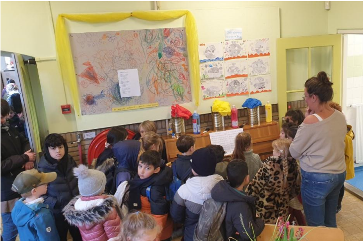
De piano in de hal is een groot succes.