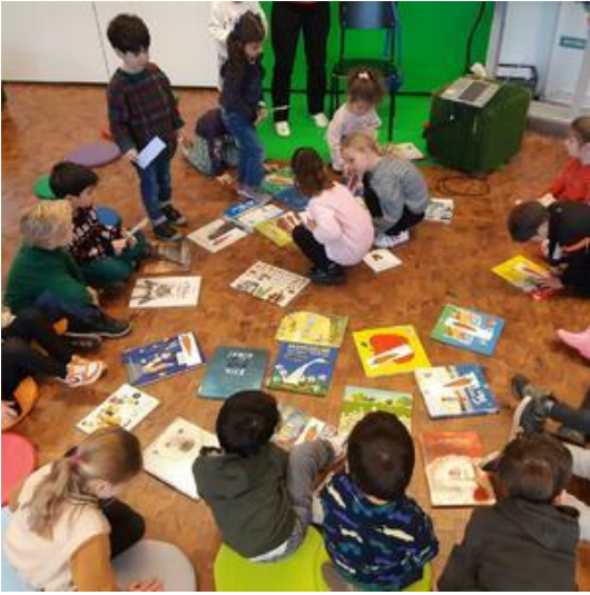
Groep 1,2A op bezoek bij de bibliotheek.