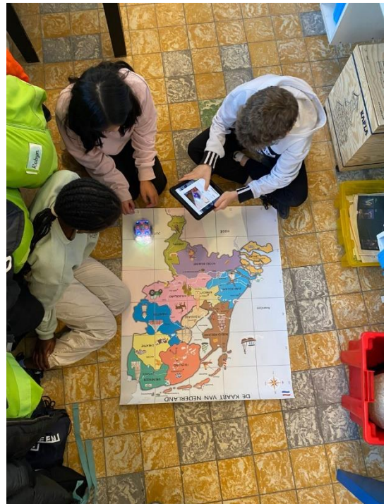
RobotWise les in groep 8.