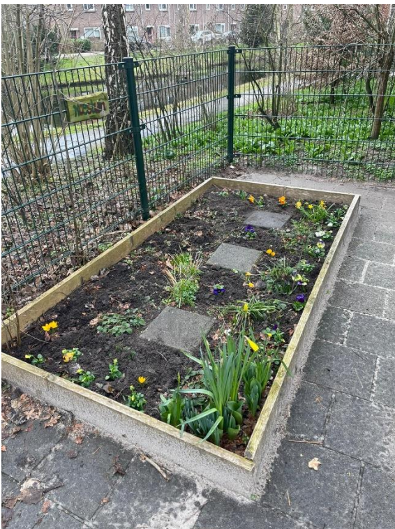
De schooltuintjes zijn weer lenteklaar gemaakt.