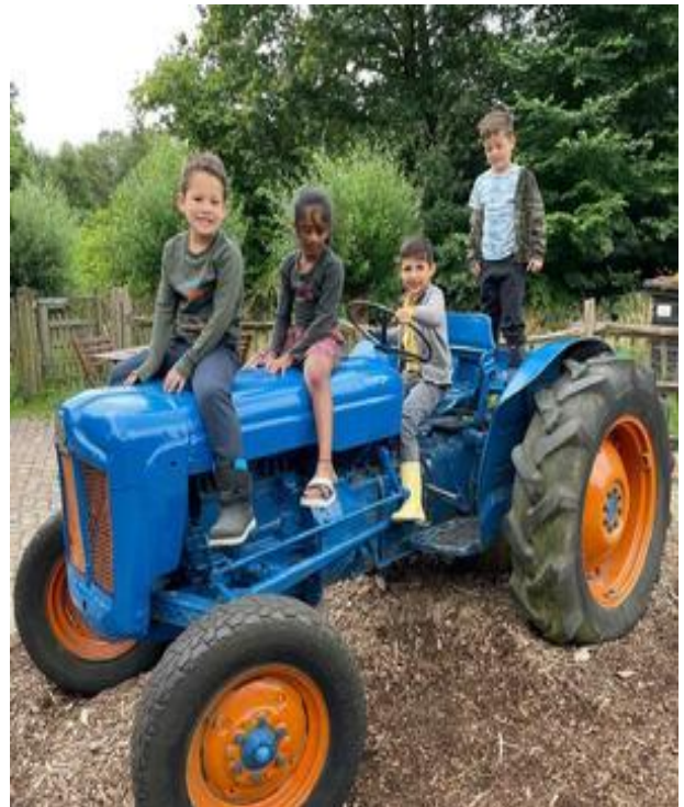
Groep 3 op bezoek bij de kinderboerderij