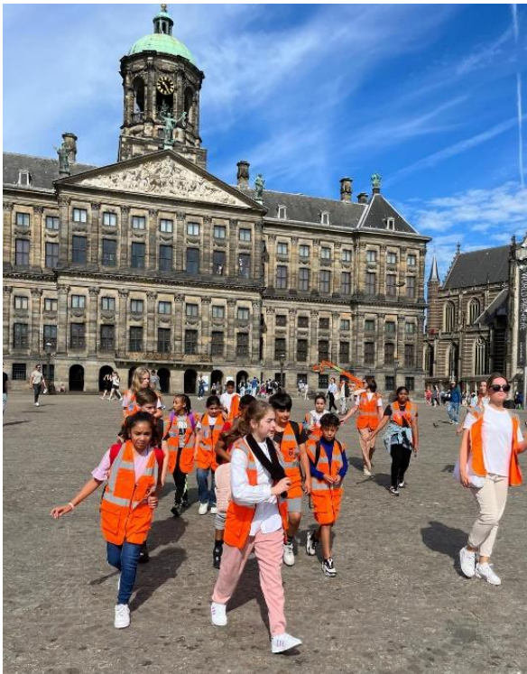
Groep 7 in Amsterdam tijdens de gebedshuizentour