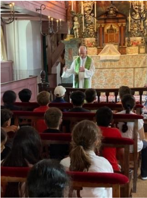
Groep 7 op bezoek bij de Katholieke kerk Museum Ons' Lieve heer op Solder