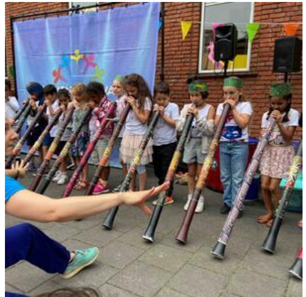
Optreden met Klankenkaravaan tijdens het zomerfeest