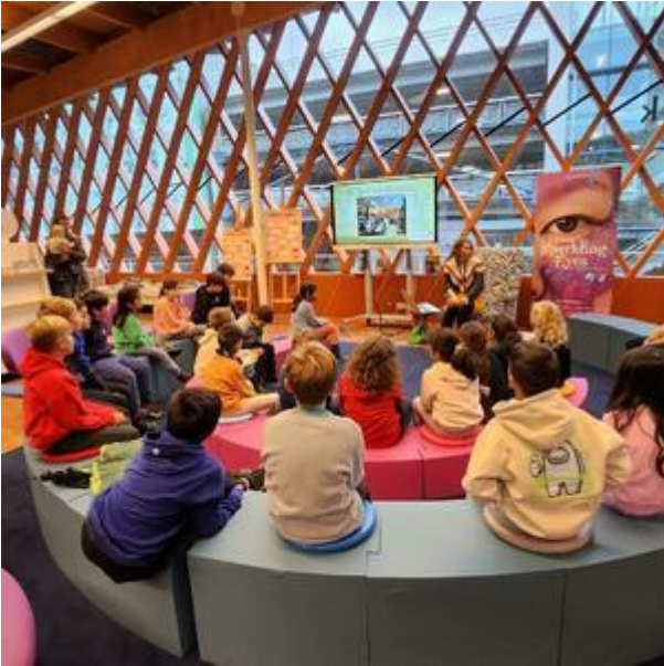
Groep 5 op bezoek bij de Bibliotheek