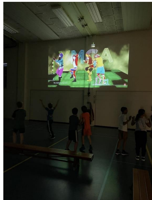
Dansles tijdens gym