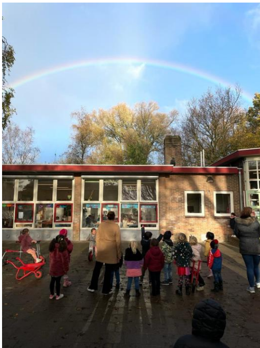
Een prachtige regenboog boven het kleutergebouw

Meer foto's vindt u op het Ouderportaal.