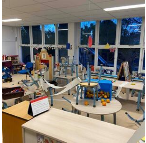
Rommelpiet bij de kleuters