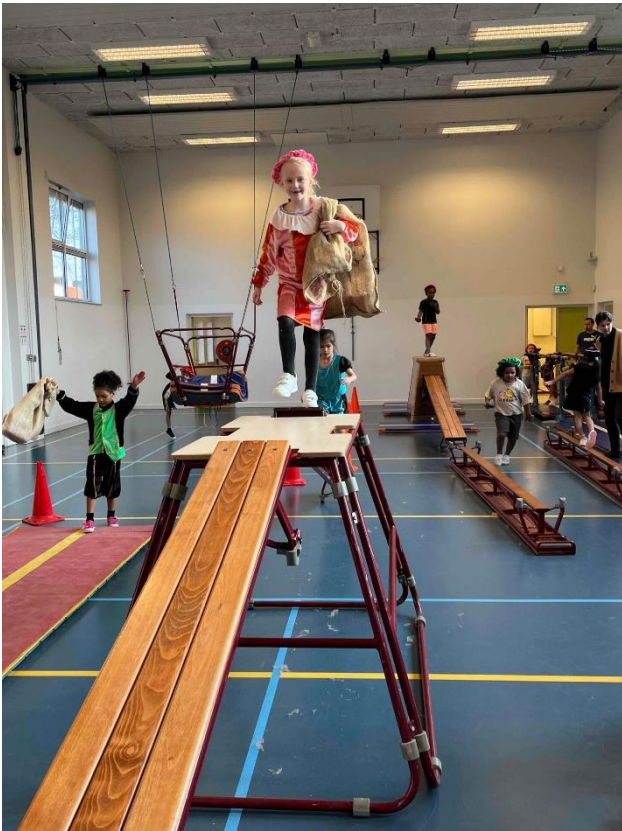
Pietengym in groep 3